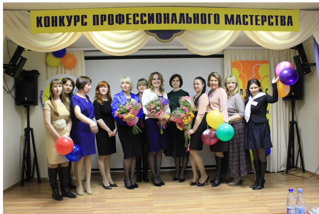
Конкурс профессионального мастерства, 2015 год

Личностные качества должны также включать порядочность, честность, бескорыстие. Для получения желаемых результатов работник должен быть целеустремлённым, трудолюбивым и ответственным. Вместе с этим эмоциональная устойчивость, спокойствие и приятный голос помогут добиться доверия нуждающихся в помощи людей.