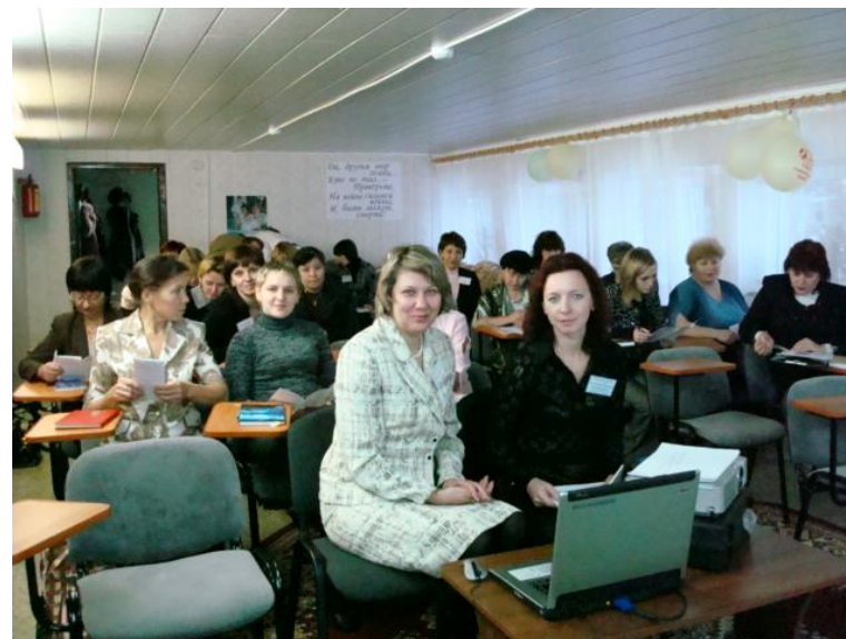
Социальные работники на семинаре «Социальные проблемы семьи» 2007 год

Заслугой такого работника становится оказание помощи в распределении и получении различного вида поддержки, в большинстве случаев материальной или правовой, от государственных социальных служб и органов опеки.