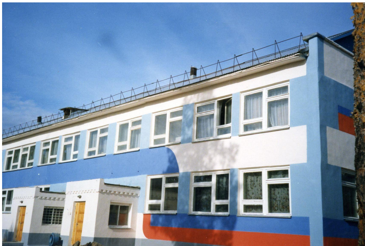
Общий вид здания Центра социальной помощи семье и детям «Горизонт» (вид с фасада). 1996 год

В 1999 году учреждение переехало в более просторное, способное вместить все необходимые отделения, здание по улице Центральной. В 2002 году центр вышел на более высокий уровень, теперь это Комплексный центр социального обслуживания, с 2006 года - Комплексный центр социального обслуживания населения «Милосердие». В 2013 году к учреждению присоединили Центр социальной помощи семье и детям «Горизонт».