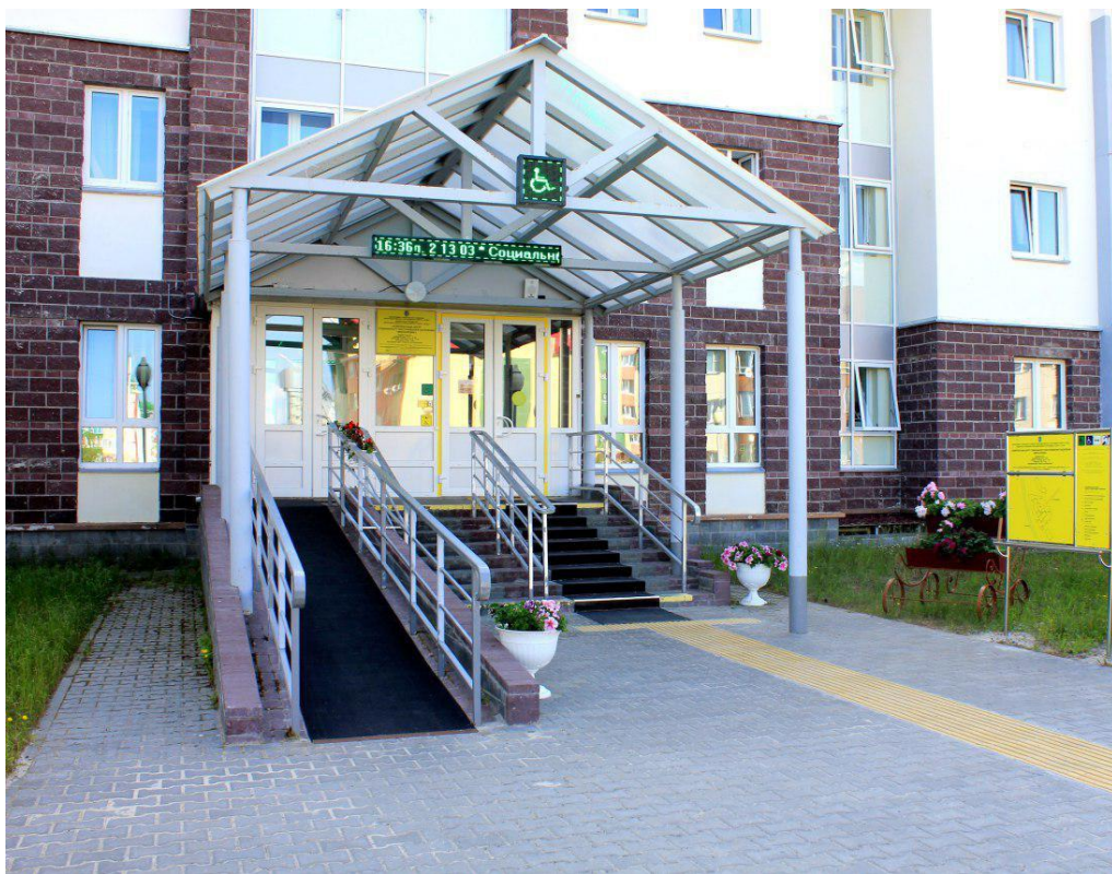
Новый корпус бюджетного учреждения Ханты-Мансийского автономного округа - Югры «Белоярский комплексный центр социального обслуживания населения», 2017 год

В 2008 году открылся новый корпус бюджетного учреждения Ханты-Мансийского автономного округа - Югры «Белоярский комплексный центр социального обслуживания населения»