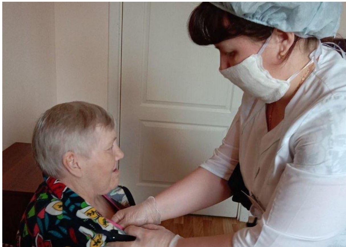
Оказание медицинской помощи в отделении