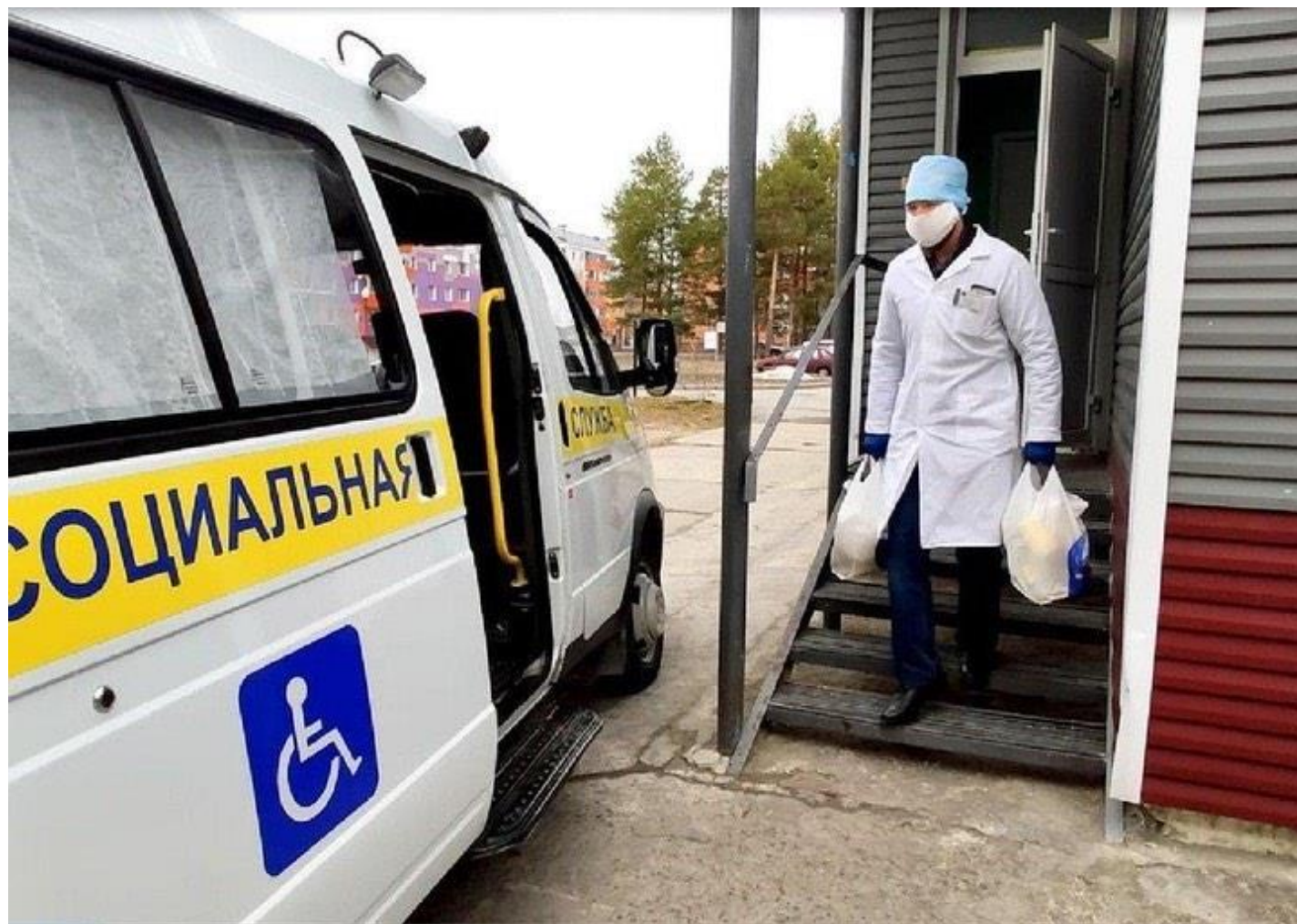
Доставка продуктов и товаров первой необходимости в период распространения новой коронавирусной инфекции, 2020 год