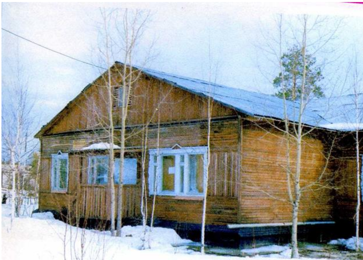
Общий вид здания Территориального центра социального обслуживания населения, 1993 год (бывший детский сад «Брусничка»)

История Белоярского комплексного центра социального обслуживания населения началась 15 ноября 1993 года, когда в здании бывшего детского сада «Брусничка» открылся Территориальный центр социального обслуживания населения.