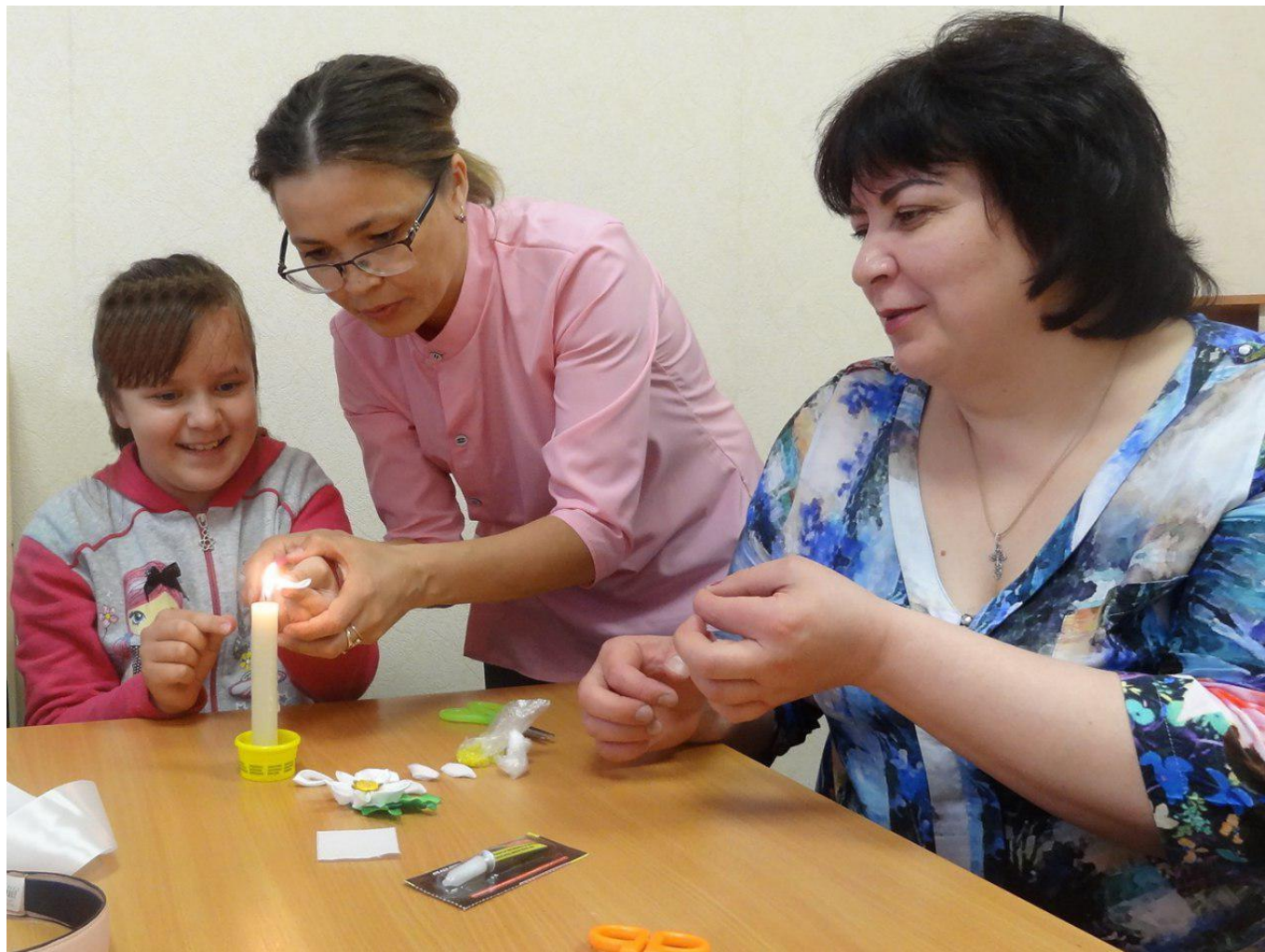
На логопедическом занятии