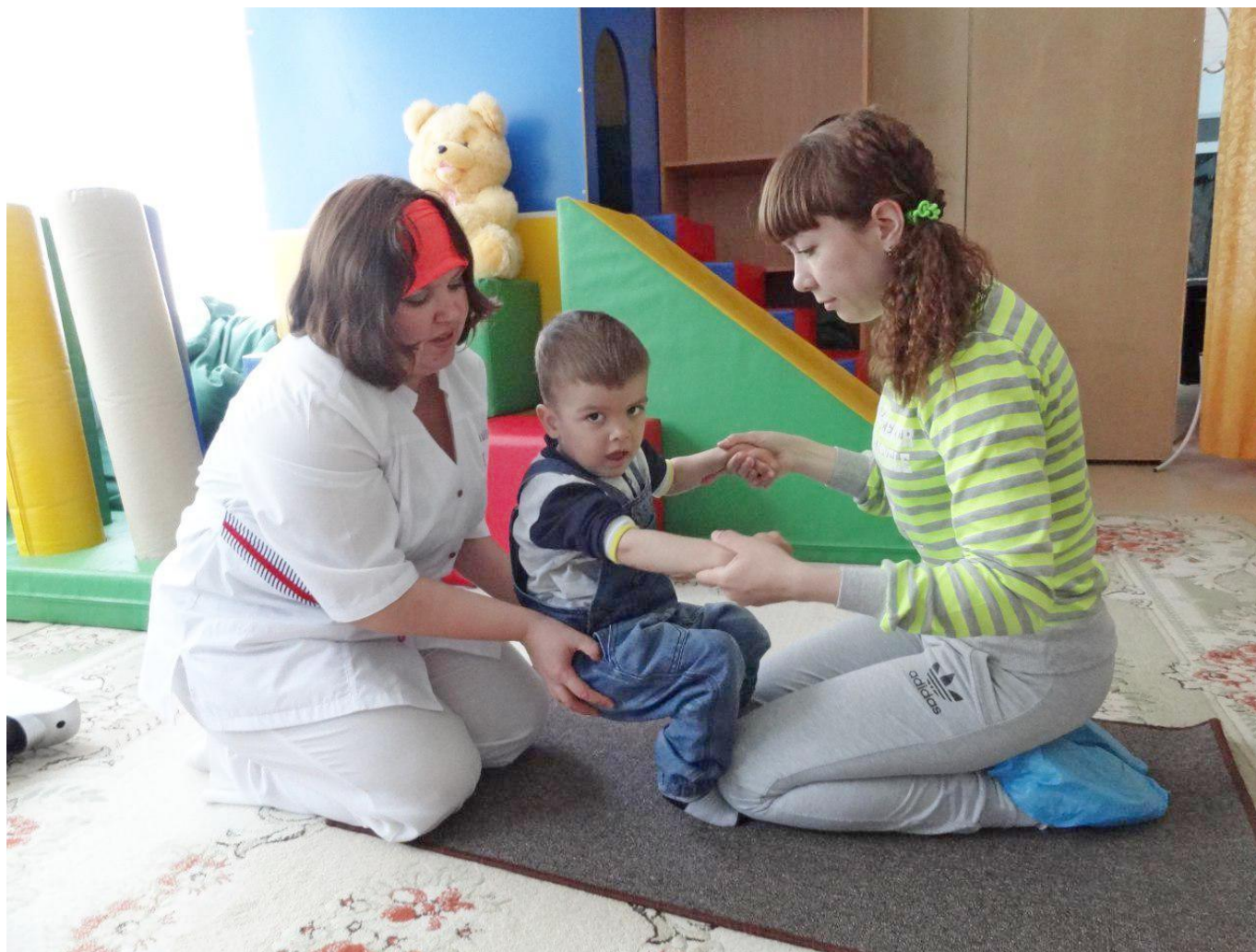
На реабилитационном занятии

Трудовые будни социальных работников бюджетного учреждения Ханты-Мансийского автономного округа – Югры «Белоярский комплексный центр социального обслуживания населения»