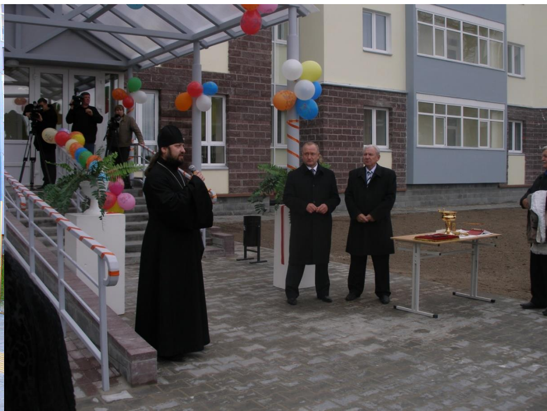
Открытие нового корпуса «Белоярского комплексного центра социального обслуживания населения», 2008 год. На фото: слева Отец Георгий, Маненков С.П. (глава Белоярского района), Филипенко А.В. (Губернатор Ханты-Мансийского автономного округа – Югры)