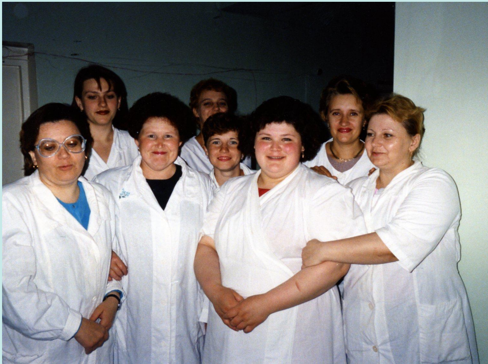
Общий снимок сотрудников родильного отделения