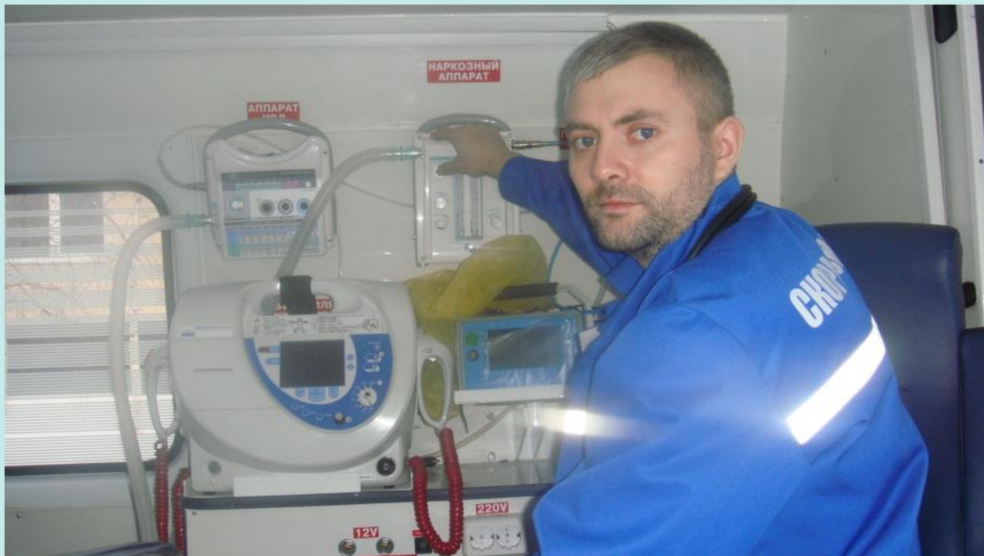
В автомобиле скорой медицинской помощи, 2016 год