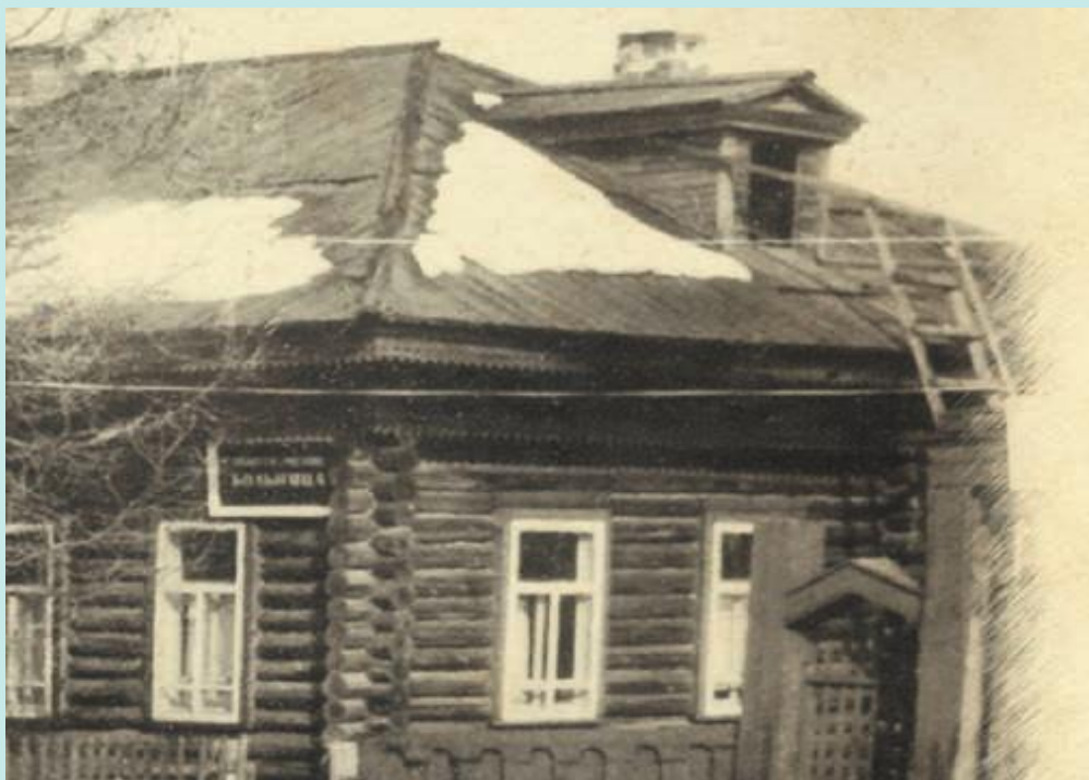
Первое деревянное здание больницы в с.Полноват. Фотокопия. 30-е годы 20-го столетия

В настоящее время в Полноватской больнице работает более 30 сотрудников. Врачебный участок состоит из населенных пунктов: с.Полноват, п.Ванзеват, д.Тугияны, д.Пашторы. В начале 2017 года в Полновате открыли новое здание участковой больницы. Стационар рассчитан на 13 коек и круглосуточное пребывание. Амбулатория оснащена стоматологическим, терапевтическим, гинекологическим, процедурным, физиотерапевтическим кабинетами, работает кабинет ЭКГ.