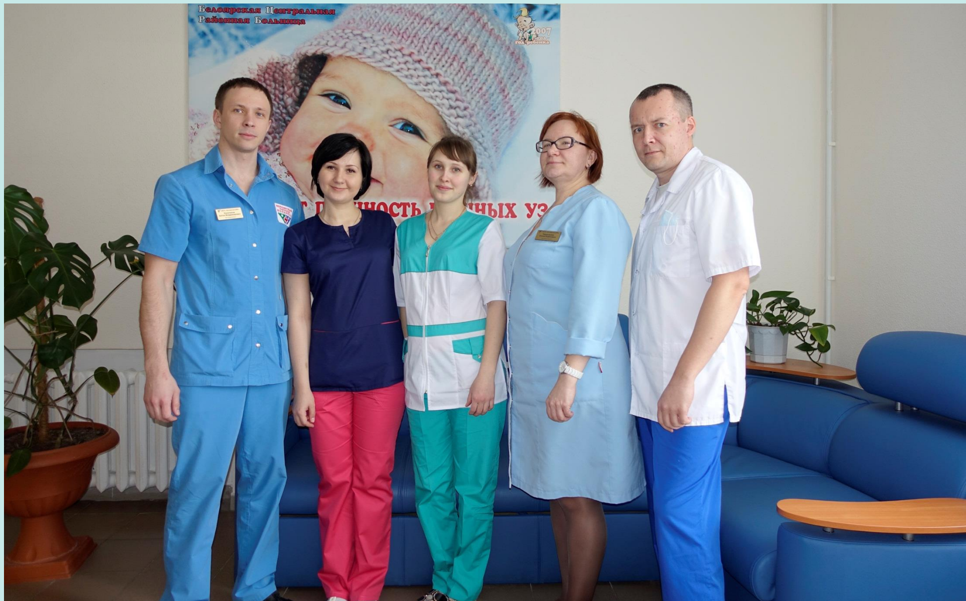
Общий снимок сотрудников родильного отделения