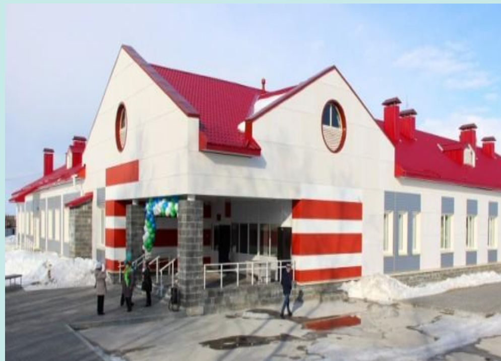
Новое здание больницы в с.Полноват. 2017 г.