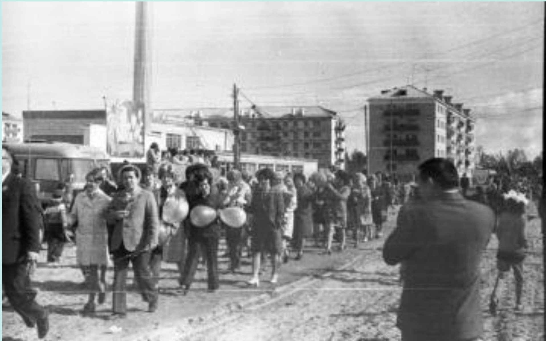
Коллектив Белоярской участковой больницы во время демонстрации трудящихся 1 Мая. 1980 год

Опись №4, ед.хр.№1, д.62_1