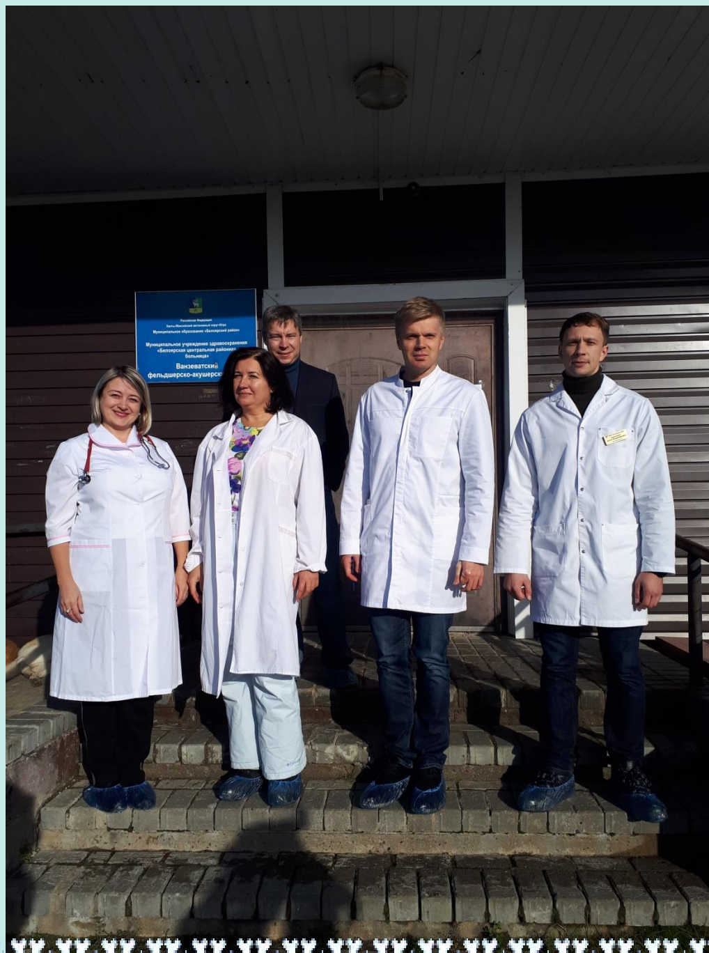
Выезд бригады (педиатр, невролог, акушер-гинеколог, главный врач и забор крови на биохимические и общеклинические исследования) в Ванзеватский фельдшерско-акушерский пункт в рамках акции «Добро в село» 2018год