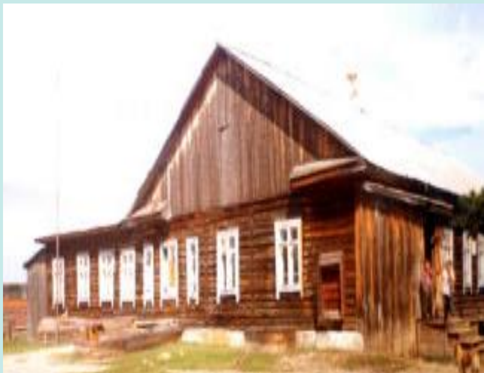
Первое деревянное здание больницы в с.Казым. Фотокопия