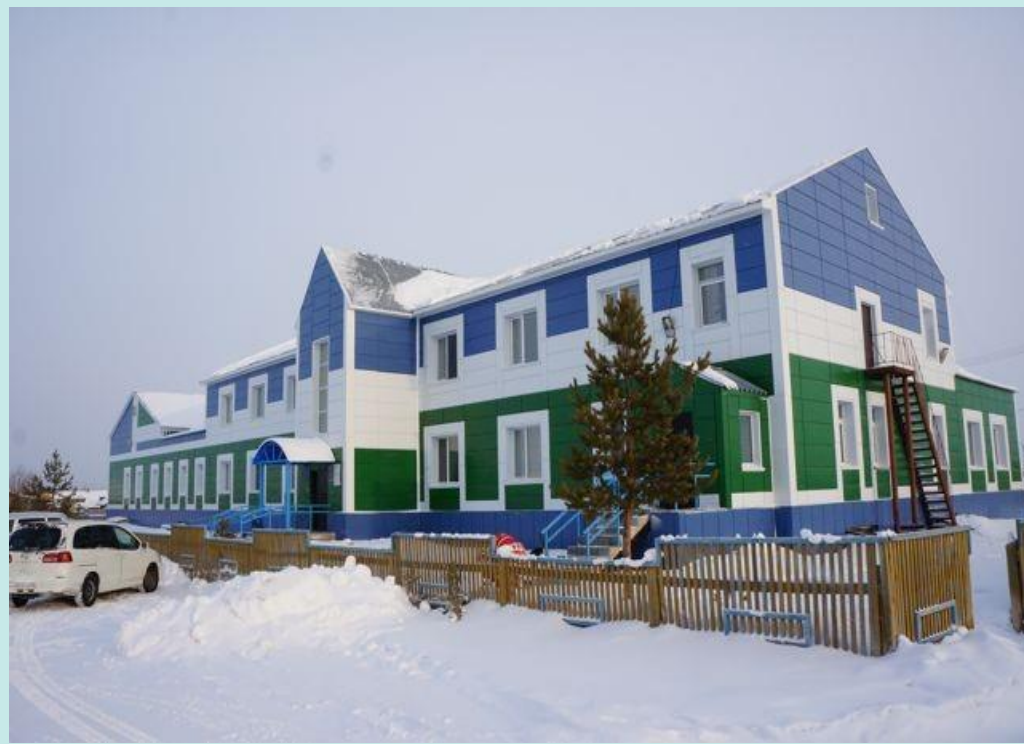
Здание больницы в с.Казым 25.12.2012 г.