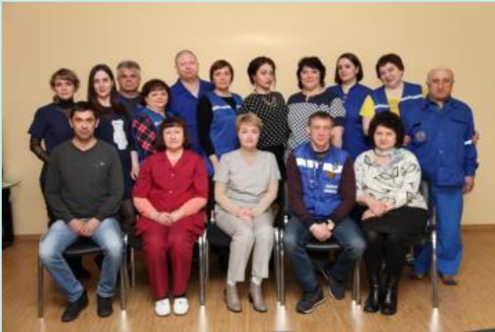
Общий снимок сотрудников скорой помощи Белоярской районной больницы. 2018 год

В отделение скорой помощи в сутки поступает до 40 вызовов, в месяц – 840, в год порядка 10000 вызовов.