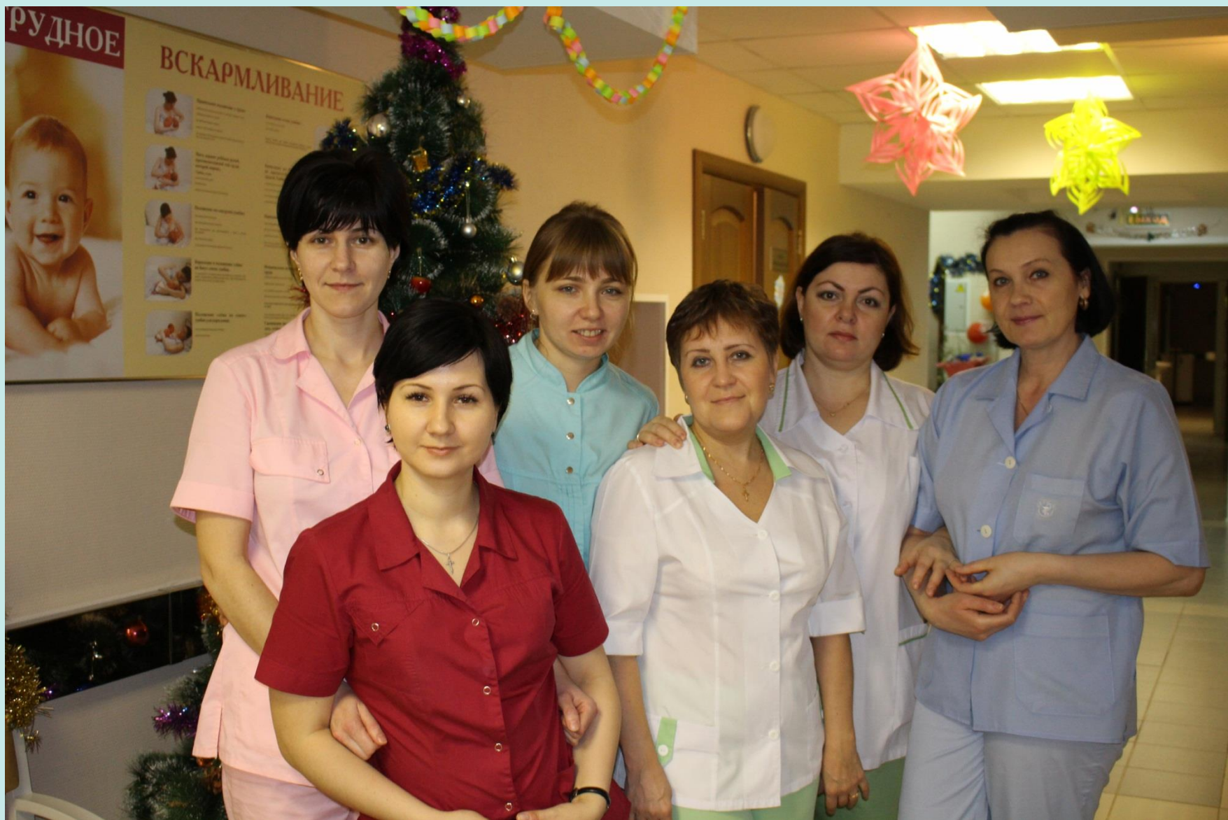
Общий снимок сотрудников родильного отделения