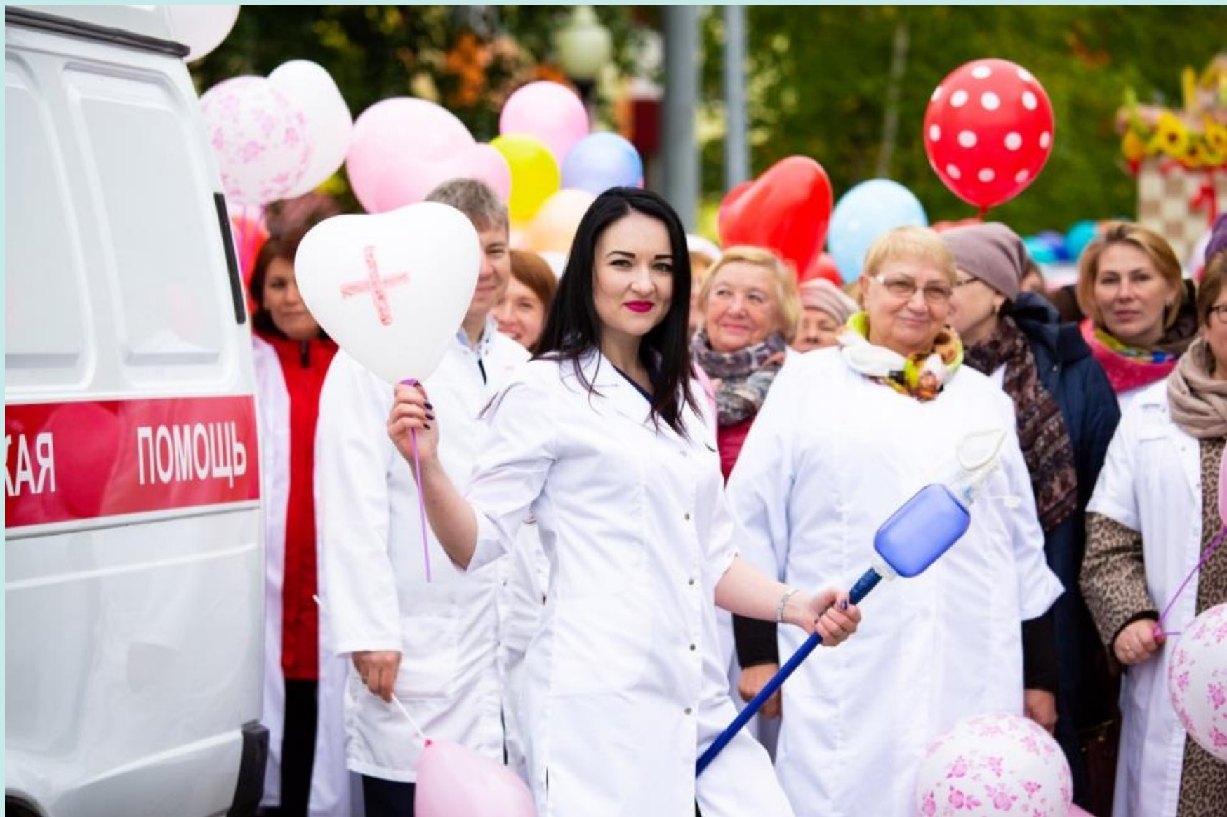
Праздничная колонна Белоярской районной больницы во время парада достижений. 2018 год.

Архивный отдел администрации Белоярского района Фотофонд. Оп.1. Д.577