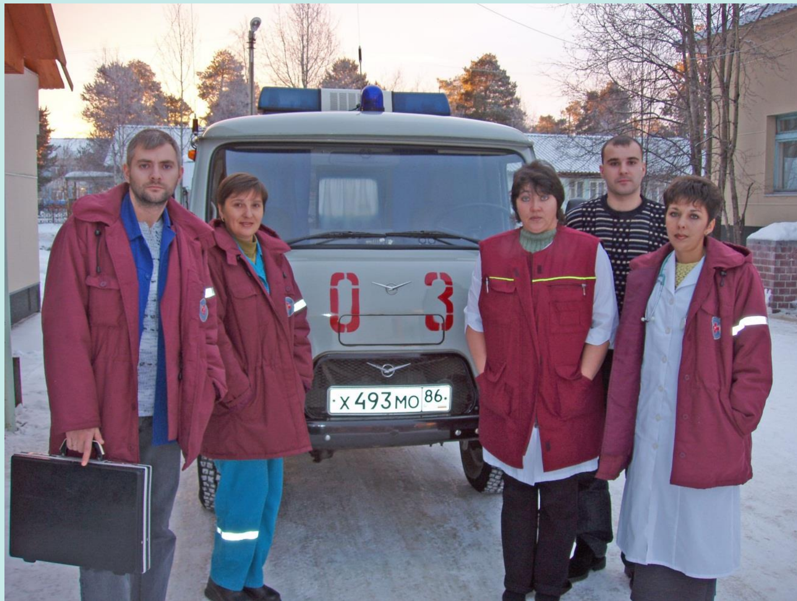
Сотрудники скорой помощи Белоярской районной больницы, 2010 год