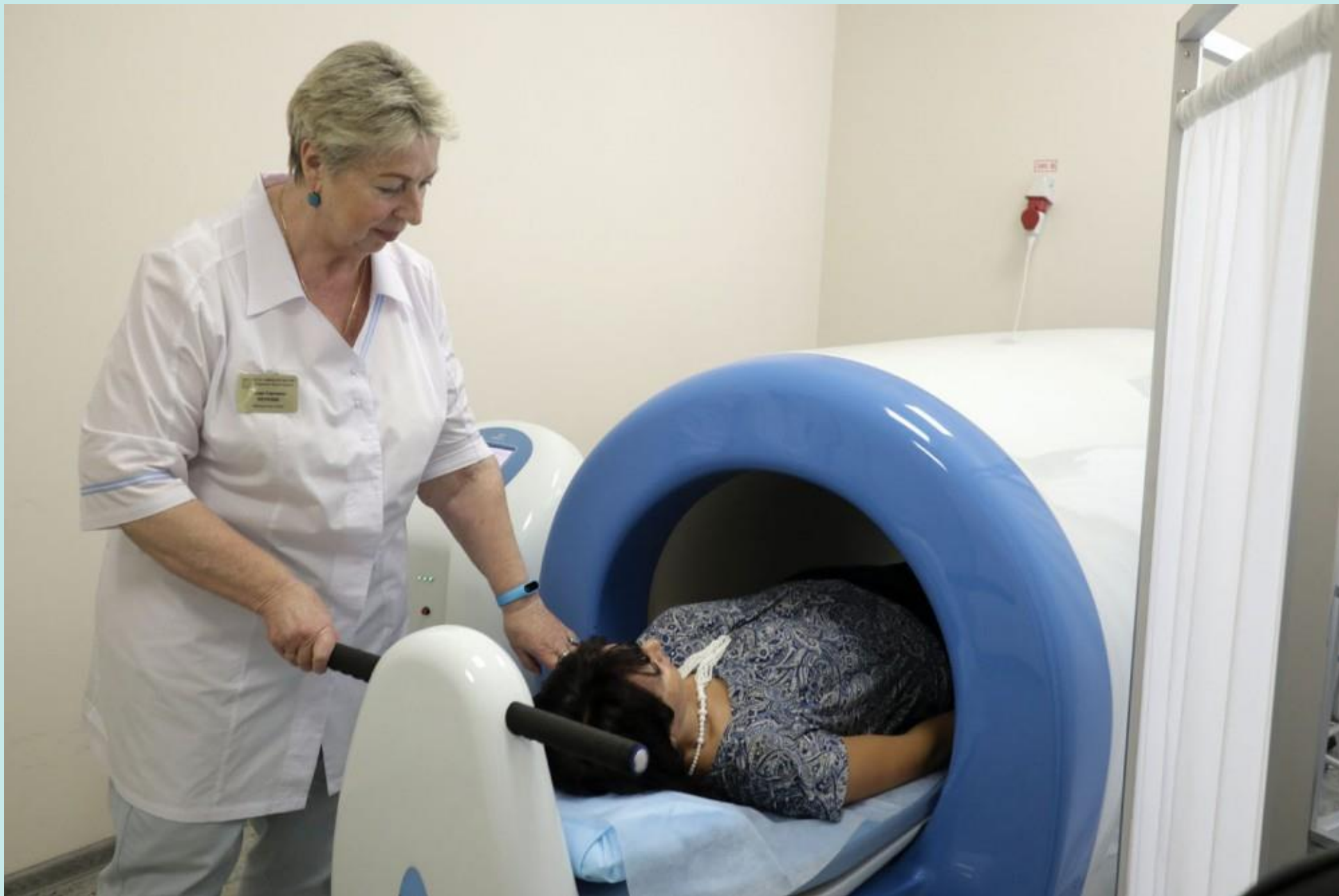
Медсестра во время проведения лечения пациента на магнитотурботроне – аппарате - капсуле для лечения и профилактики болезней путём воздействия магнитного поля. 2018 год