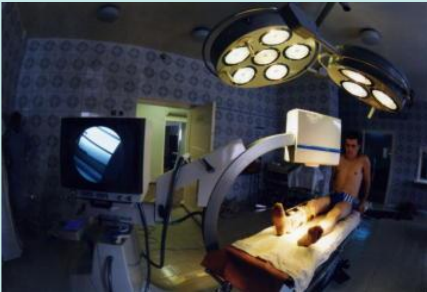
Общий вид кабинета рентгендиагностики Белоярской центральной районной больницы. 2009 год

Белоярская больница сегодня – это современное лечебно-профилактическое учреждение, где есть все условия для проведения диагностики и лечения взрослых и детей, реабилитации после перенесенных болезней и травм.